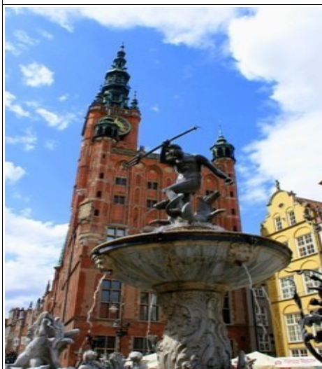
Fontanna Neptuna w Gdańsku