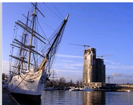
Port w Gdyni