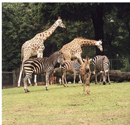
Poznań - ZOO