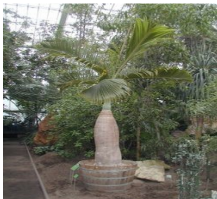
Palmiarnia w Poznaniu