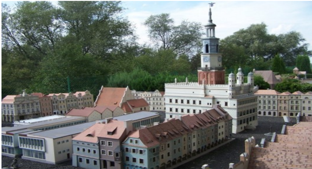
Skansen Miniatur w Pobiedziskach